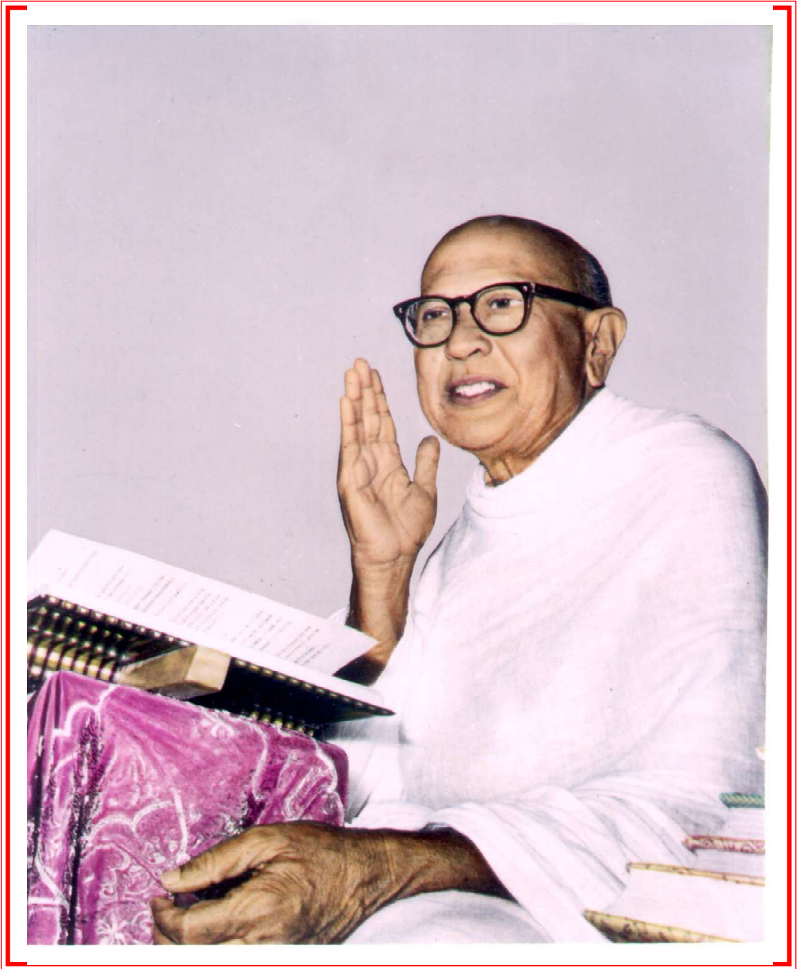
अध्यात्मयुगसर्जक पूज्य गुरुदेवश्री कानजीस्वामी